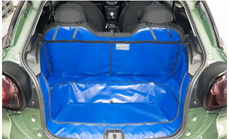
Achter Plus met gesplitste stoelen, voorbereid voor stoel flap