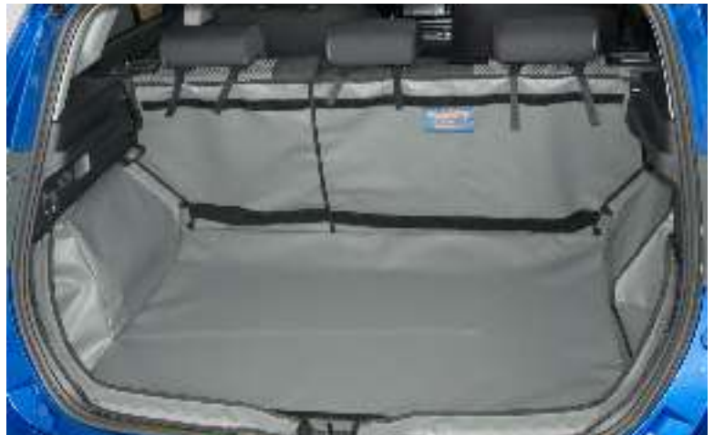
Achter Plus met gesplitste stoelen, voorbereid voor Stoel Flap, Bumper Flap en Bodemverlenging