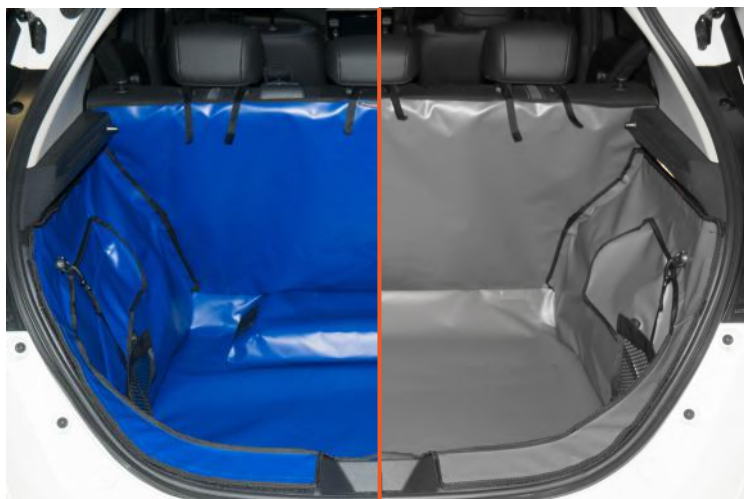
SPK-luidspreker op kofferbak bodem /SPKNO- geen luidspreker Achter Plus kofferbakbescherming