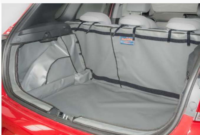
VORM 4 - LINKERKANT