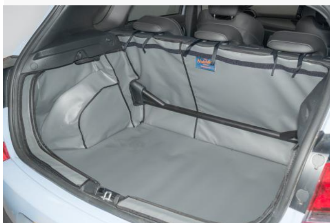
VORM 5 - LINKERKANT