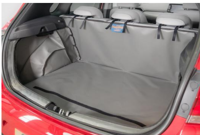
VORM 3 – LINKERKANT