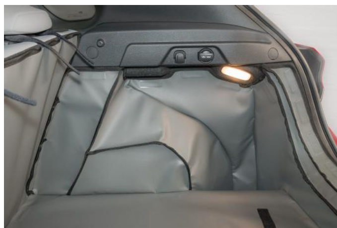
VORM 3 - RECHTERKANT