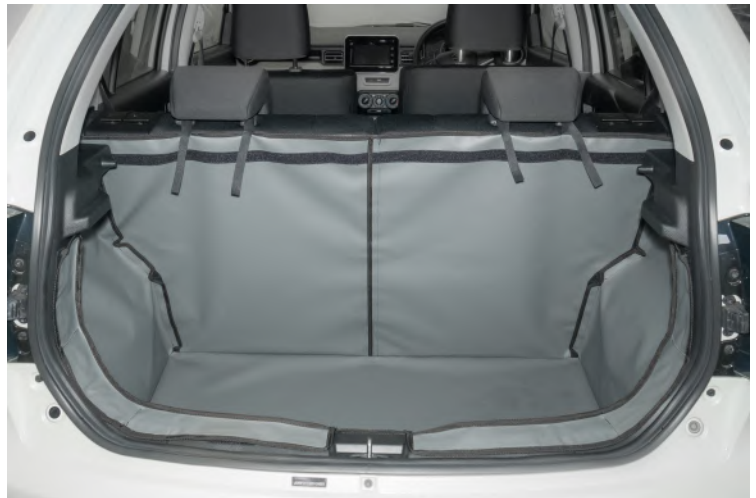
Achter Plus met gesplitste stoelen voorbereid voor een stoel flap