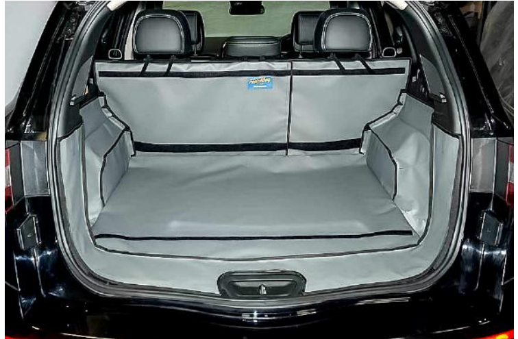
Achter Plus met gesplitste stoelen voorbereid voor Bumper Flap, Stoel Flap en Bodemverlenging