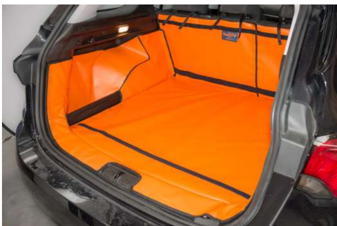
VALUE VLOER VERHOOGD — BESTUURDERSKANT