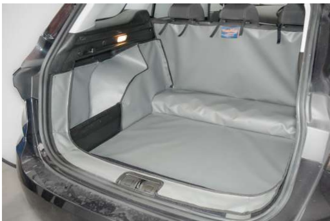
VALUE VLOER VERLAAGD — BESTUURDERSKANT