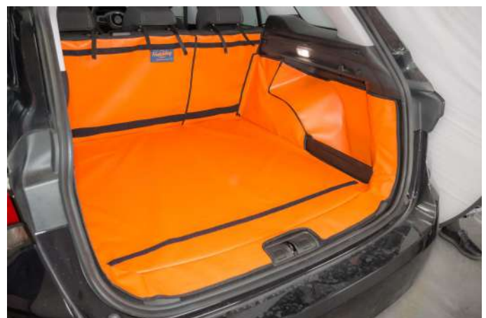
VALUE VLOER VERHOOGD — PASSAGIERSKANT