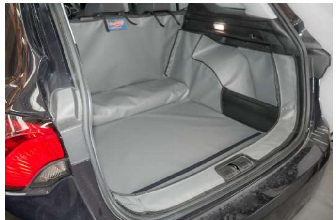
VALUE VLOER VERLAAGD — PASSAGIERSKANT