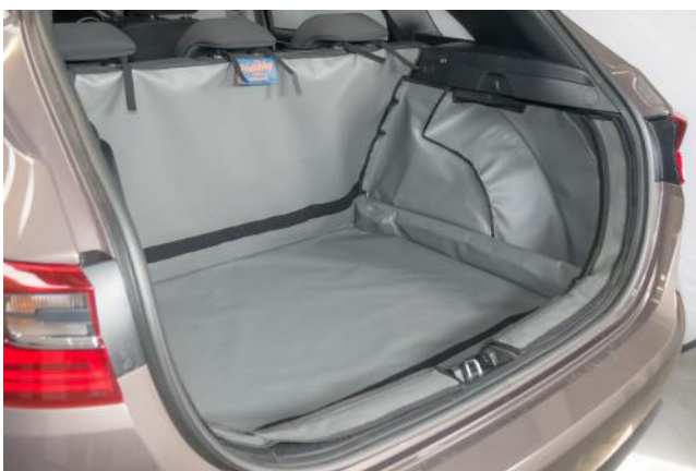
Valse vloer verlaagd