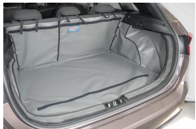
Valse vloer verhoogd