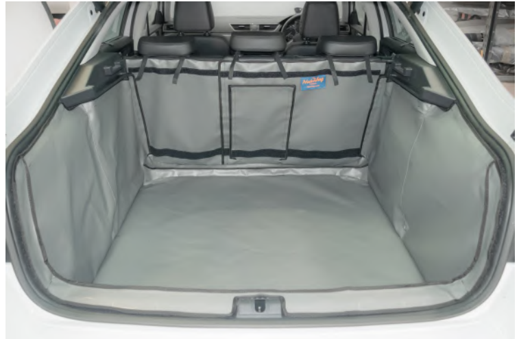
Achter Plus kofferbakbescherming met ski flap en bevestigingen voor stoel flap en bodemverlenging