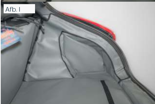
FRSD - valse vloer verhoogd