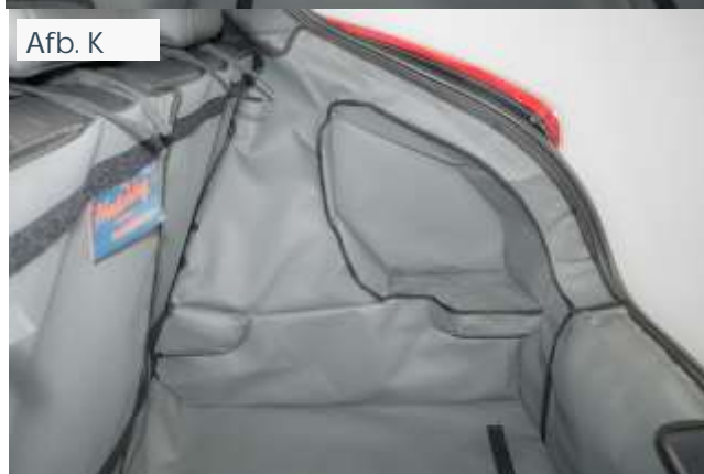
FOUT - valse vloer verwijderd