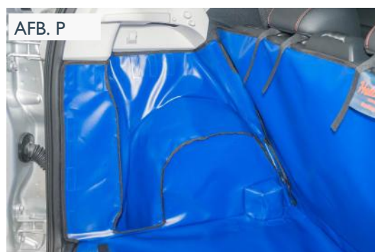
FMID VERSIE- BESTUURDERSKANT