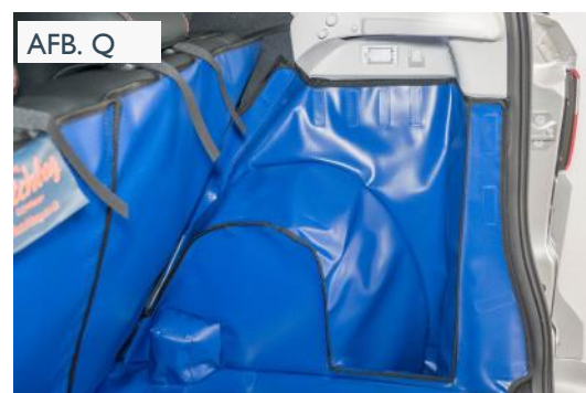
FMID VERSIE - PASSAGIERSKANT