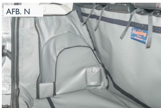
“FOUT” VERSIE - BESTUURDERSKANT