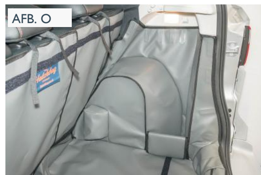
“FOUT” VERSIE - PASSAGIERSKANT