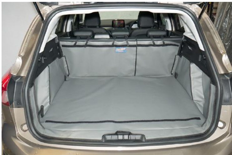
Achter Plus Gesplitste kofferbakbescherming met bevestigingen voor stoel flap en bumper flap