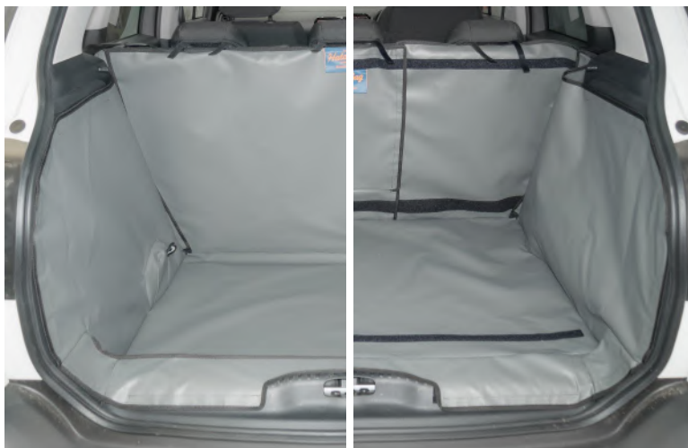
Links: Valse vloer verlaagd – Achter Plus Rechts: Valse Vloer verhoogd – gesplitste kofferbakbescherming voor bumper flap, stoel flap and bodemverlenging