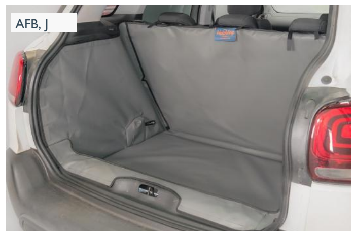
FLOW - VALSE VLOER VERLAAGD