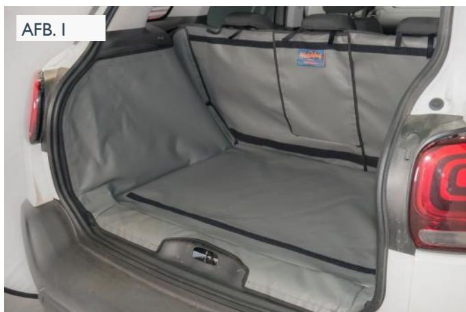
FRSD - VALSE VLOER VERHOOGD

Maak de het klittenband op de kofferbakbeschermer vast aan de net geplaatste stukken klittenband. (Afbeeldingen I & J)