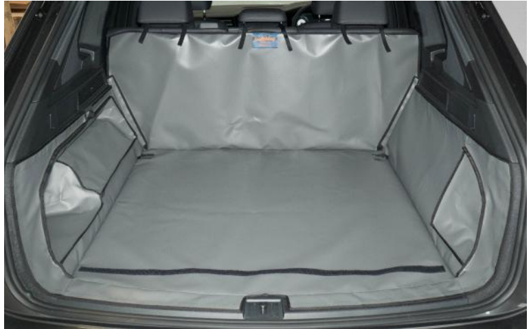
Rear Plus voor bumper flap