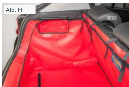
Versie zonder valse vloer