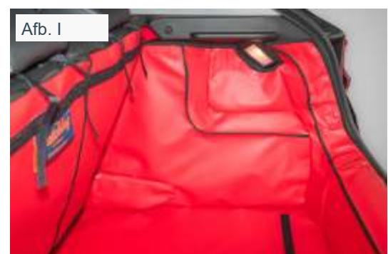
Versie zonder valse vloer