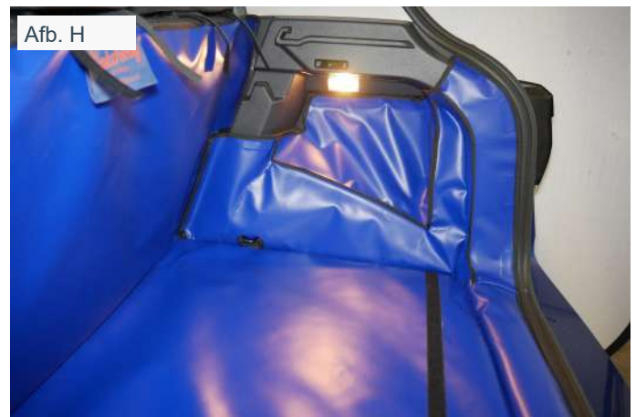
Afb. H FRSD - rechts - Achter Plus kofferbakbescherming met bevestiging voor bumper flap