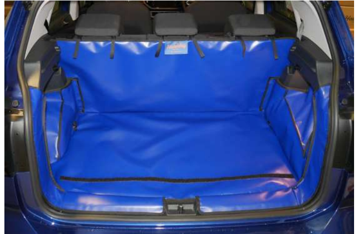
FRSD Achter Plus beschermhoes met bevestiging voor bumper flap.