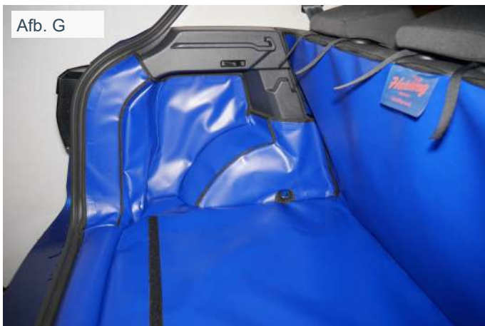
Afb. G FRSD - links - Achter Plus kofferbakbescherming met bevestiging voor bumper flap