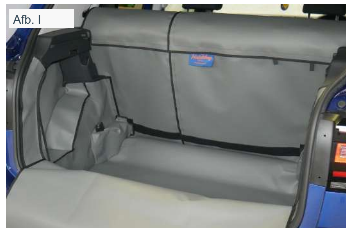
Afb. I FLOW - links - Achter Plus met gesplitste stoelen, bevestigingen voor stoel flap, bodemverlenging en bumper flap