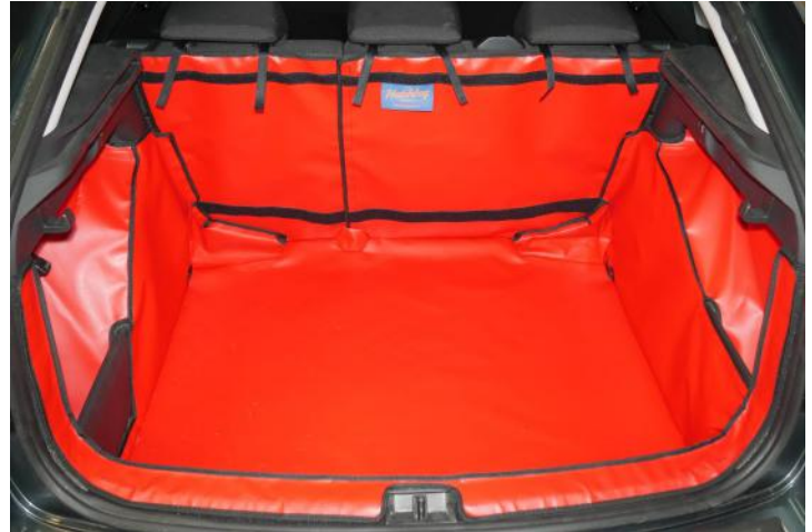
Achter Plus met gesplitste stoelen kofferbakbescherming voorzien voor stoel flap en bodemverlenging