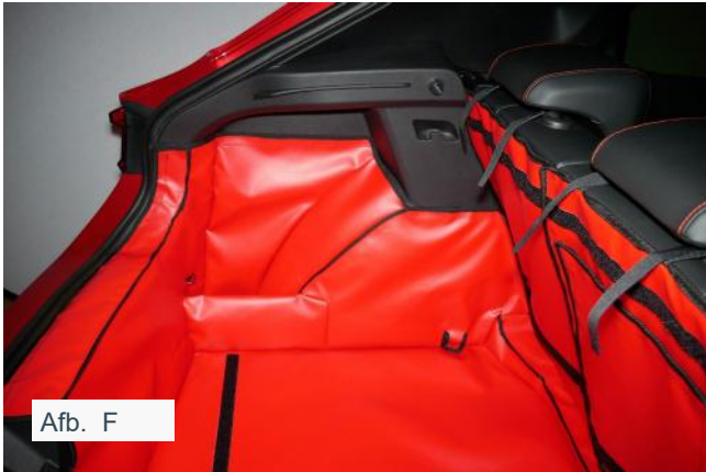
FNO – Geen valse vloer