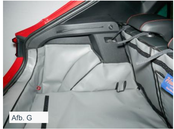
FRSD - Verhoogd vloer