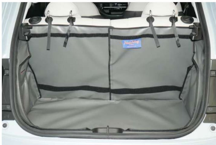
Achter Plus met gesplitse stoelen voorzien voor stoel flap en bodemverlenging en bumper flap