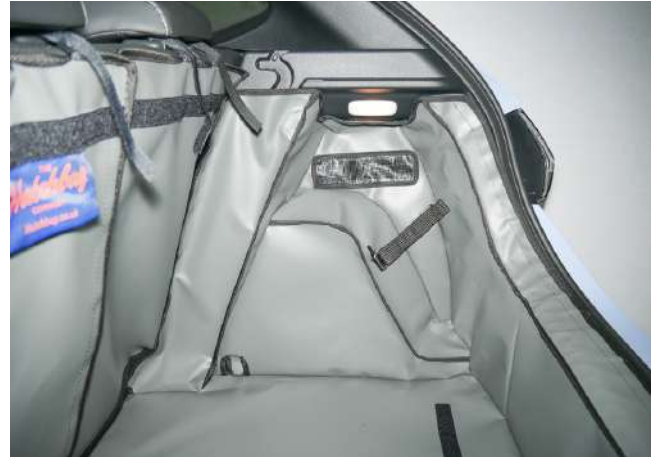
SH1- FNO - rechterzijde