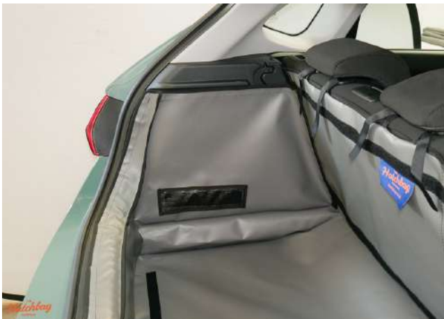
SH2-FLOW-SPKNO - linkerzijde