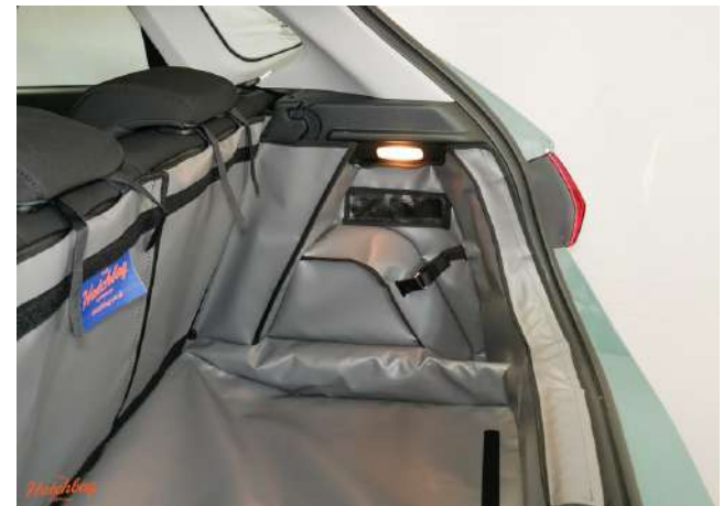
SH2- FLOW-SPKNO - rechterzijde