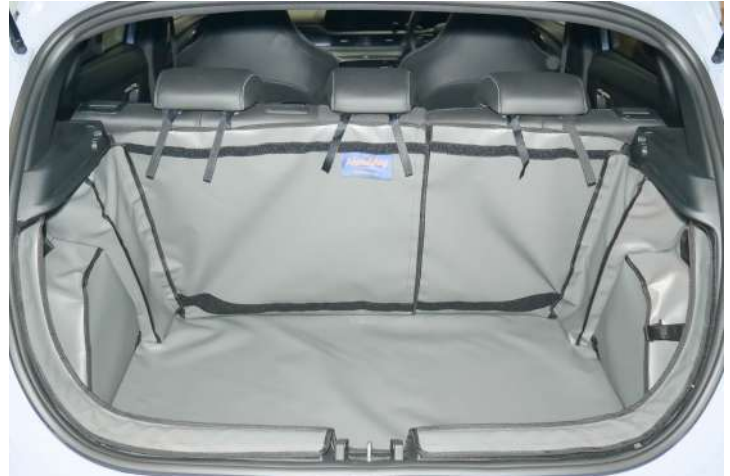
SH1- FNO - Gesplitste kofferbakbescherming, voorbereid voor stoel flap, bumper flap & bodemverlenging