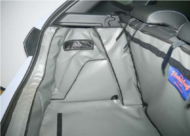
SH1-FNO - linkerzijde