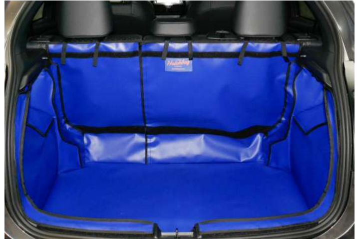
Gesplitste achterklepbeschermer, voorbereid voor stoel flap, bumper flap & bodemverlenging