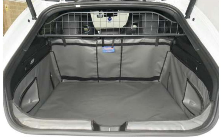
SH1-NETNO- Gesplitste kofferbakbescherming, voorbereid voor stoel flap & bodemverlenging