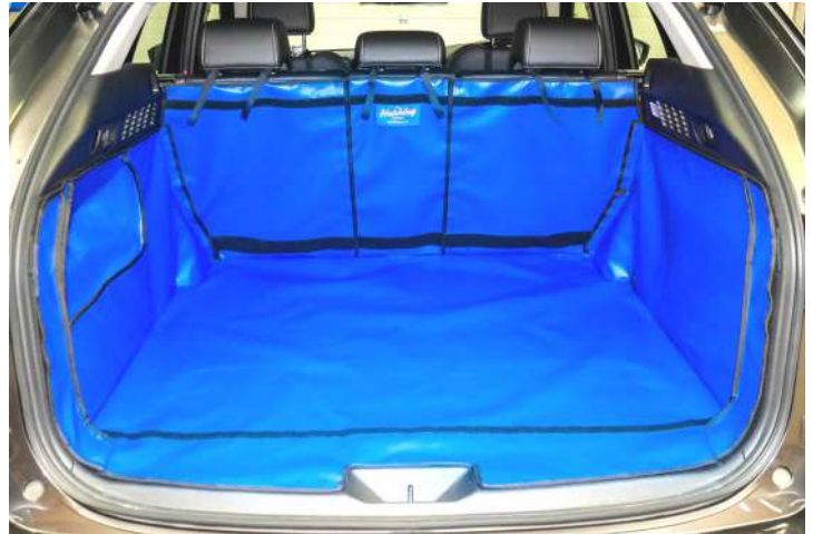
Gesplitste kofferbakbescherming, voorbereid voor stoel flap, bumper flap & bodemverlenging